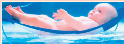
A BABY AND CHILDREN engedélyével

A függőágy ma a BABY AND CHILDREN egyik vezető terméke, és a vállalkozás a mintaoltalom által biztosított jogi monopóliuma birtokában továbbra is forgalmazza termékét a nagyvilágban.