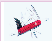
A Victorinox Ltd. engedélyével

A formatervezési mintának a nemzeti vagy regionális szellemi tulajdon-védelmi hivatalnál történő lajstromozásával a jogosult oltalmat, azaz kizárólagos jogot szerez arra, hogy megakadályozza a minta mások általi illegális másolását vagy utánzását . Ez üzletadatoságot teremt, hiszen javítja a vállalkozás versenyképességét, és növeli a jövedelmezőséget.