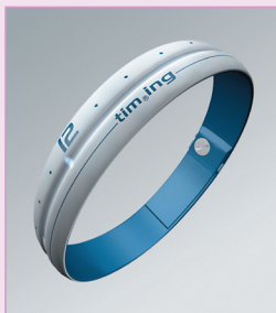
TimeRing karóra, ügyszám: D0300371

Példa egy térbeli formatervezési mintára: